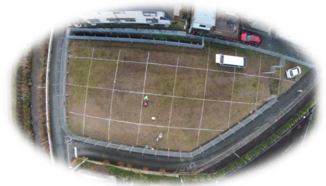
地中レーダー探査(作業状況空撮写真)