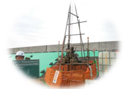
熊本地震災害復旧のため、ボーリング・土質試験を実施(熊本市内)

平成 28 年度 熊本農地海岸特定災害復旧事業 熊本農地海岸地質調査業務 (農林水産省九州農政局土地改良技術事務所；右写真) 御船町一丁目他 1 地区土質調査業務 嘉島町災害公営住宅整備候補地土質調査業務 (独立行政法人都市再生機構) 北熊本(4)整備工場新設等土質調査 (熊本防衛支局)