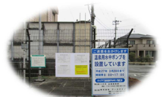
地下数百mに温泉水中ポンプ設置(八代市内)

令和 2 年度 中尾山トンネル水文観測業務 (国土交通省九州地方整備局八代河川国道事務所) 令和 2 年度 長者原集団施設地区水源調査業務 (環境省九州地方環境事務所)