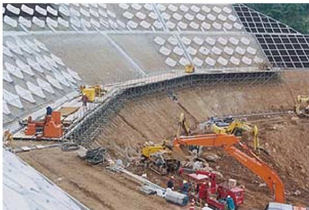
災害復旧のための水抜き工施工状況