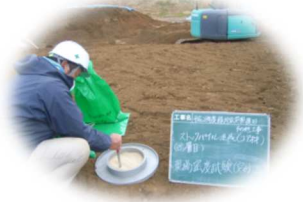
緑川ダムにおける品質管理試験